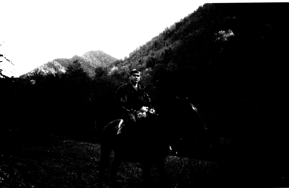
1997 р. Кодорі. Кінна стежа УНСО.

Ми вийшли до урвища висотою метрів 200. Ані росіяни, ані грузини не могли собі уявити, що тут може спуститися непомітно більш-менш значний підрозділ, тим паче спустити боєприпаси й інше військове обладнання, тож якогось серйозного спостереження за цією ділянкою не велось. На мотузках спустилися вниз самі та спустили озброєння й боєприпаси. Було ще темно, тож зробити це було нелегко, але, на щастя, обійшлося без