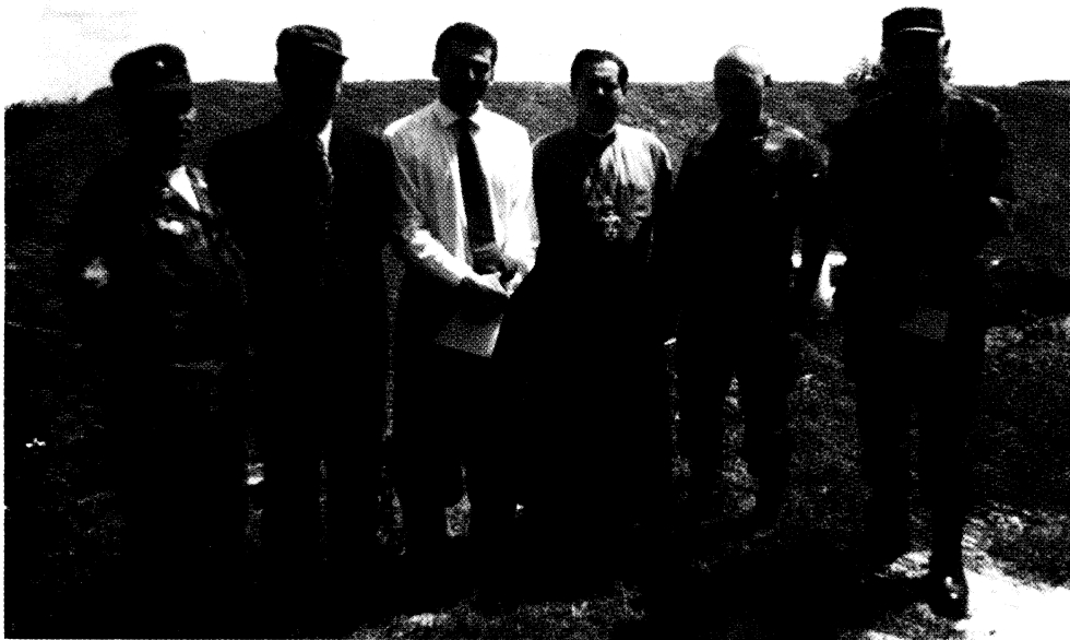
2003 рік, Байковий цвинтар у Києві. Десята річниця штурму Шроми. Біля могил полеглих унсовців посол Грузії в Україні Григол Катамадзе.

Колонізація Кавказу була завжди успішною завдяки чинному в міжнаціональних відносинах принципу «всі проти всіх». Особливо божевілья охопило Закавказзя в двадцяті роки минулого століття. Вірменія воювала з Грузією, Азербайджан з Вірменією, Конфедерація Гірських народів, як п'яна, хиталась між меншовиками, більшовиками, мусаватистами — і це в той час, як із пів-